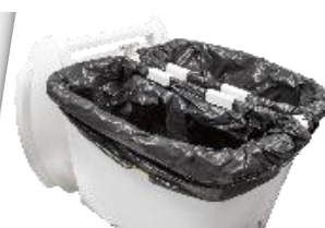
séparateur de sacs