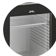
CLAYETTE EN VERRE