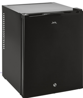
REF 8 66 1351 Minibar TA 30 L porte pleine UL 1 : 1