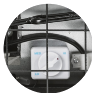
TEMPÉRATURE RÉGLABLE À L'ARRIÈRE