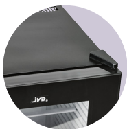
ADAPTATIFS PORTE RÉVERSIBLE

Dimensions : -30L Porte pleine : H. 525 x L. 381 x P.446 mm -30L Porte vitrée : H. 525 x L. 381 x P.442 mm -40L Porte pleine : H. 545 x L. 403 x P.436 mm -40L Porte vitrée : H. 545 x L. 403 x P.431 mm