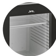
CLAYETTE EN VERRE