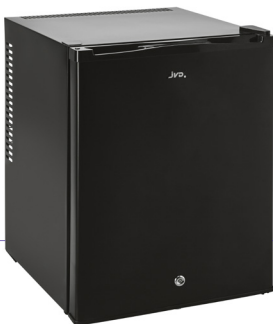
REF 8 66 1351 Minibar TA 30 L porte pleine UL 1 : 1