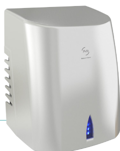
REF 8 11 1168 Copt'air automatique alu gris métal UL 1 : 4