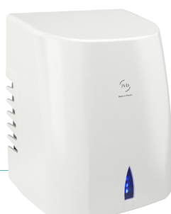
REF 8 11 1167 Copt'air automatique alu blanc UL 1 : 4

+ REF 5 30 1899 Filtre anti-bactérien UL 1 : 1