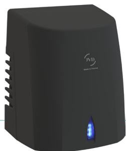
REF 8 11 1377 Copt'air automatique alu noir UL 1 : 4