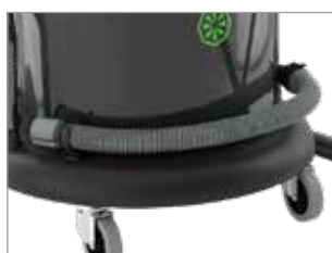
TUYAU DE VIDANGE