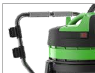
CHARIOT AVEC POIGNÉE