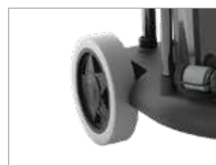
GRANDES ROUES ARRIÈRE ANTI-TRACE