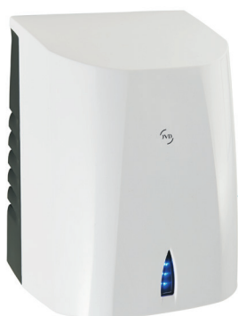
REF 8 11 1056 Sup'air automatique blanc

Sèche-mains automatique à air pulsé à faible consommation d'énergie (500 W). Garantie 3 ans pièces et main d'oeuvre.