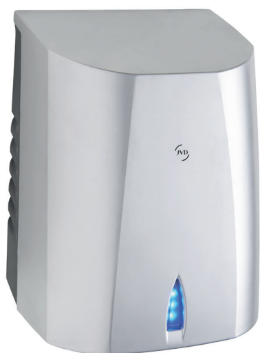
REF 8 11 1057 Sup'air automatique Gris métal