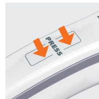
SYSTÈME DE POIGNÉE INTERRUPTEUR BREVETÉ