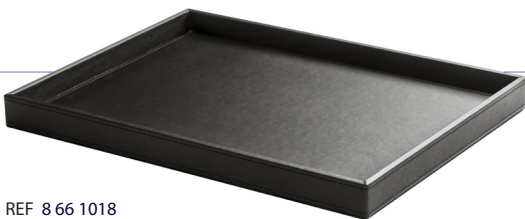
REF 8 66 1018 Plateau Charme UL 1 : 12