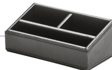
REF 8 66 1020 Porte-sachets Charme UL 1 : 54